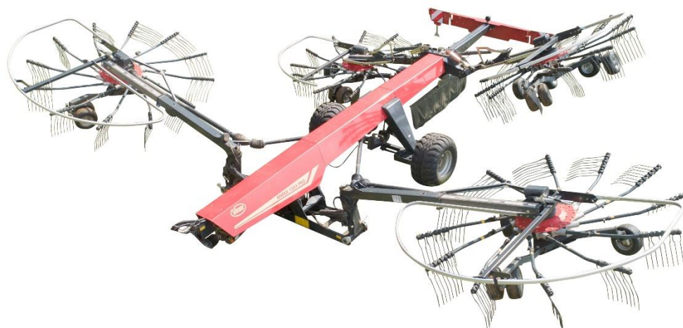
Relevage individuel des quatre rotors

Alors que l'Andex 1304 est déjà équipé de série d'un relevage avant et arrière séparé, d'une commande très simple, d'un boîtier à bain d'huile haute performance, du réglage hydraulique de la largeur de travail et de la largeur d'andainage sur les rotors avant et arrière, le 1304 PRO dispose également de solutions innovantes pour encore gagner plus en efficacité.